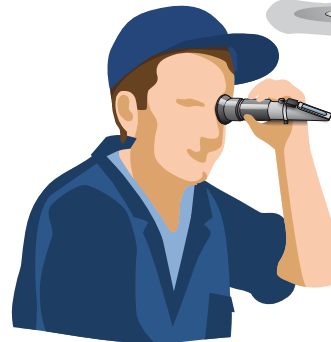
2 Kwaliteit meten