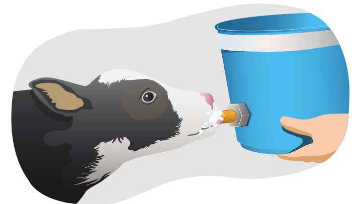
7 Na 12 - 18 uur 2 e melking voor 2 e biestvoeding