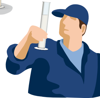
3 Biest controleren op vuil