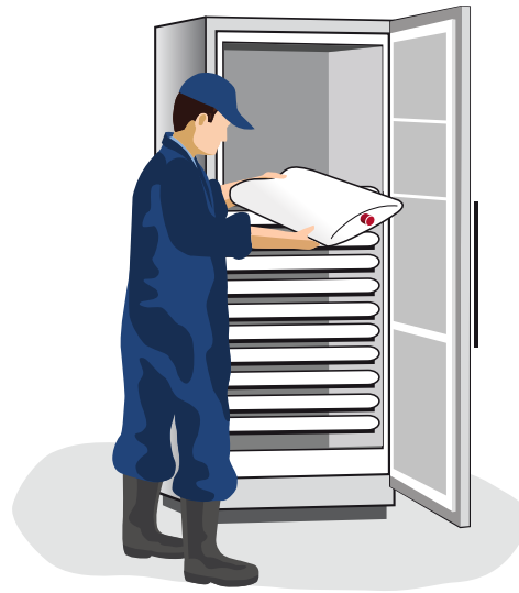
6 Overige biest invriezen voor reserve