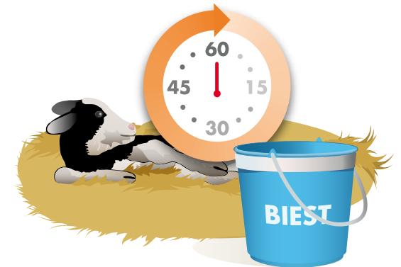
4 Binnen 1 uur 4 liter biest geven