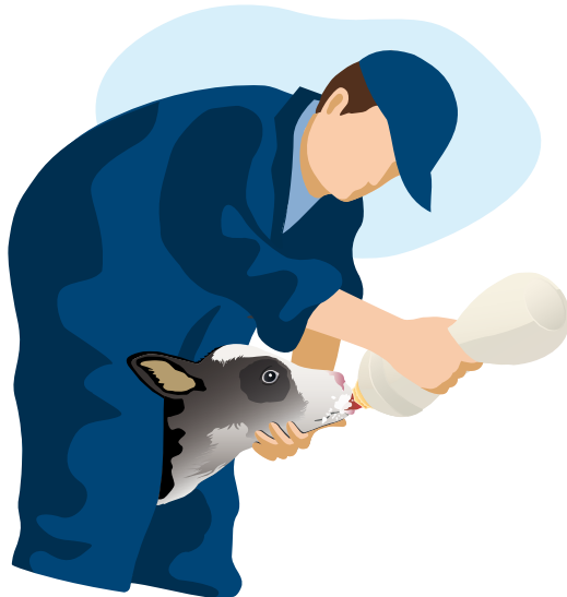
5 Toedienen biest